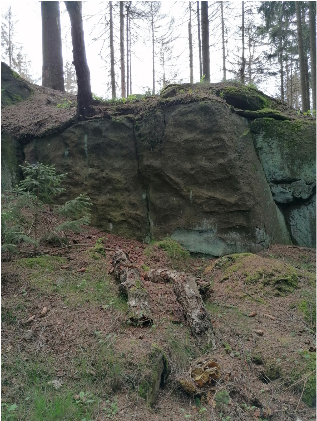
Obrázek č. 1/1