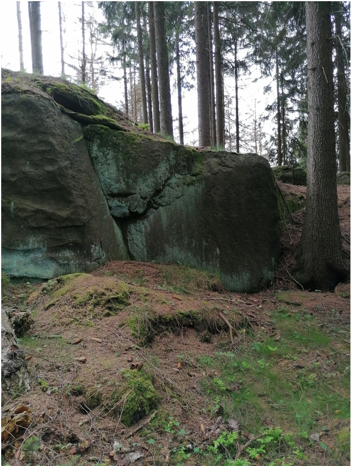
Obrázek č. 1/2